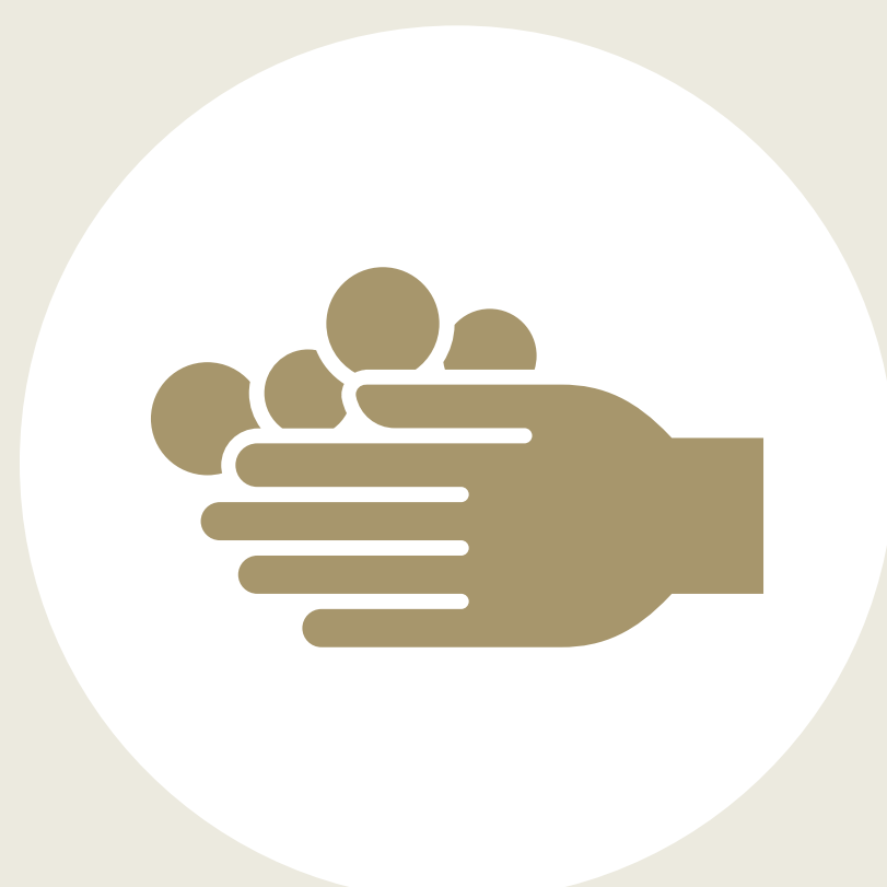
こまめな 手洗い・うがいの徹底