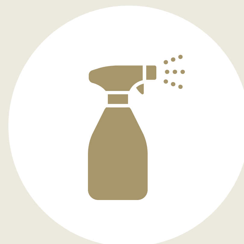
各種施設内の 洗浄・除菌