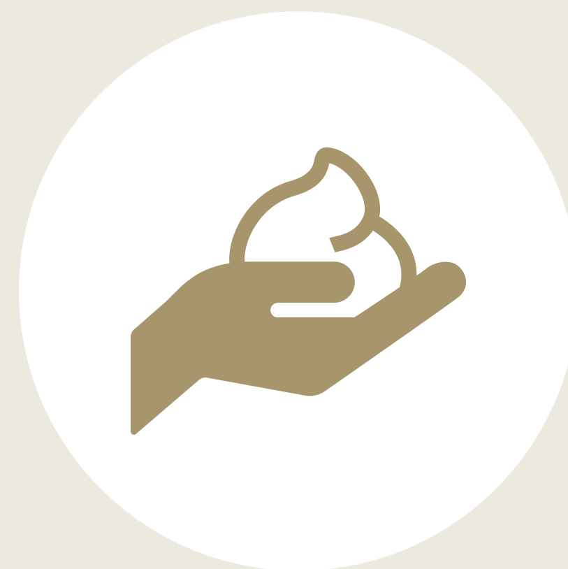
洗面化粧室に ハンドソープ設置