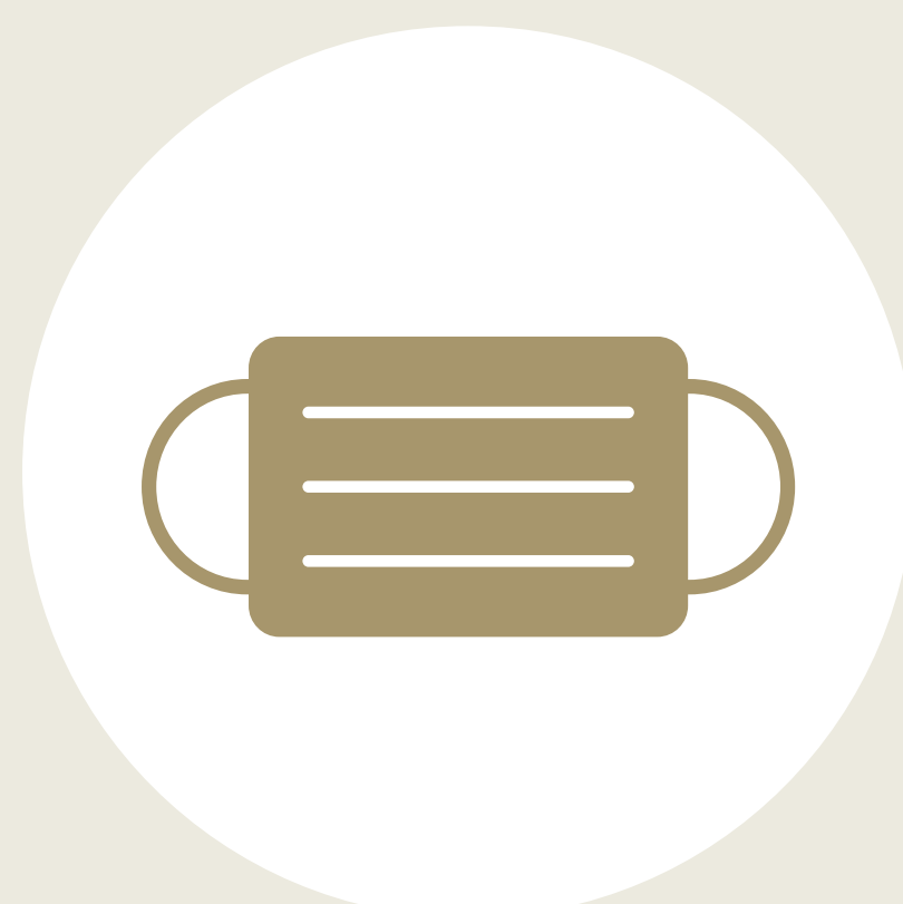
全スタッフの マスク着用