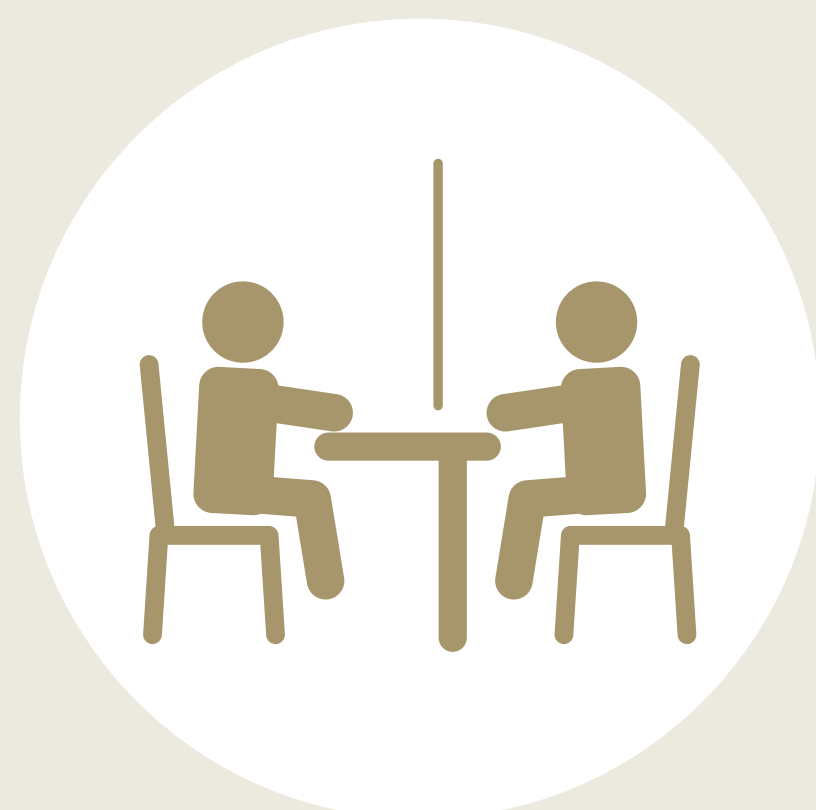
飛沫防止パーテーション の設置